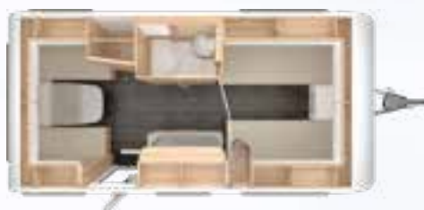
VIVALDI 460 E 2,3