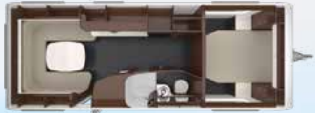
PUCCINI 685 DF 2,5