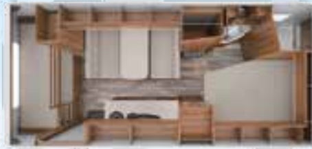
DA VINCI 550 DM 2,3