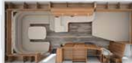
DA VINCI 560 TDL 2,5