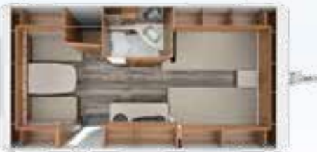
DA VINCI 460 E 2,3