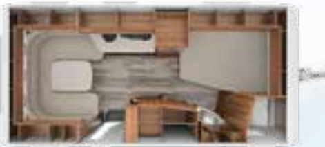
DA VINCI 490 TD 2,3