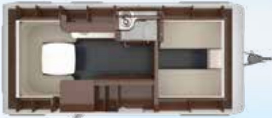
PUCCINI 550 E 2,5