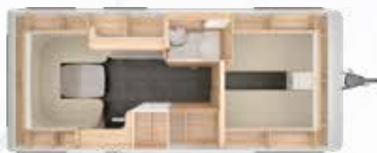
VIVALDI 550 E 2,3