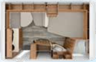
DA VINCI 380 TD 2,3