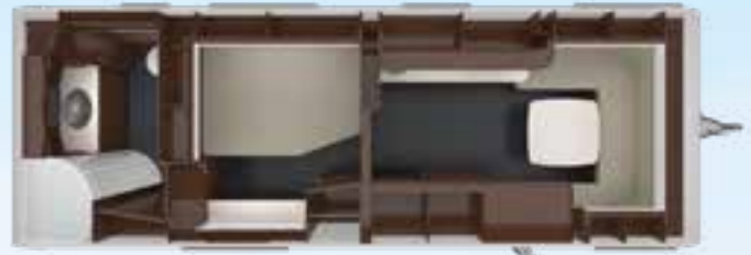
PUCCINI 750 HTD 2,5