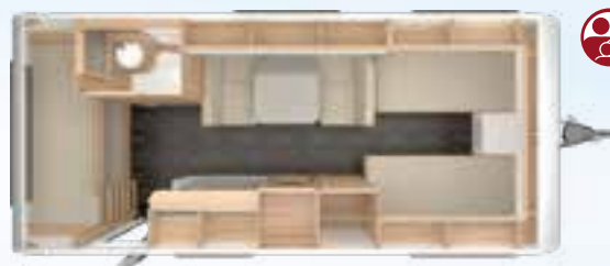
VIVALDI 560 EMK 2,5