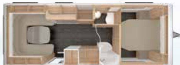
VIVALDI 685 DF 2,5