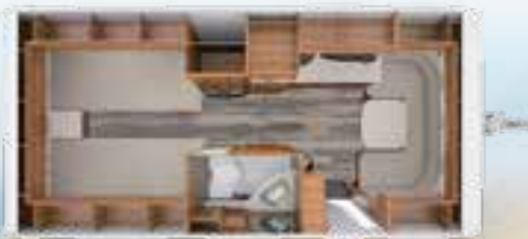
DA VINCI 495 HE 2,3