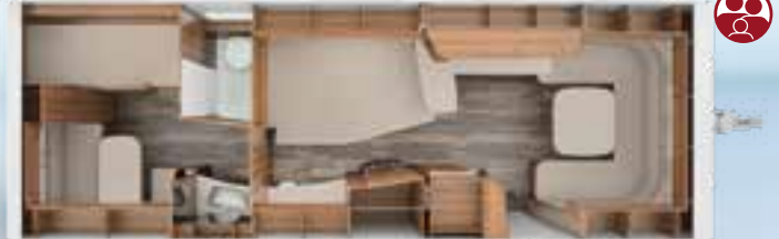
DA VINCI 700 KD 2,5