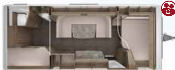
ROSSINI 620 DM 2,5