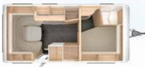
VIVALDI 490 TD 2,3