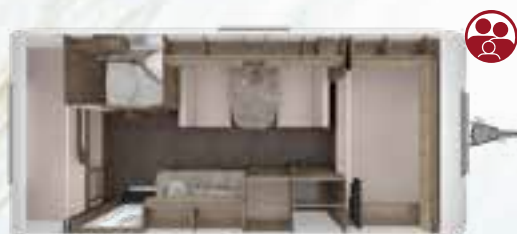
ROSSINI 490 DM 2,3