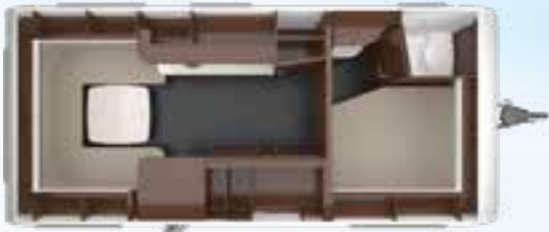
PUCCINI 560 TD 2,5