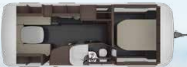
CELLINI 655 DF 2,5