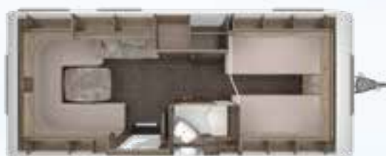
ROSSINI 540 E 2,3