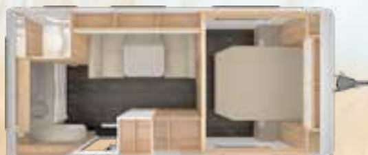
VIVALDI 550 DF 2,5