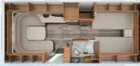
DA VINCI 540 E 2,3