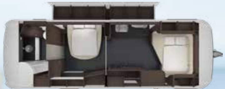
CELLINI 750 HTD 2,5 SLIDE OUT