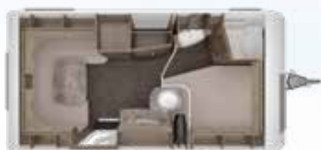
ROSSINI 450 TD 2,3