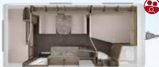
ROSSINI 520 DM