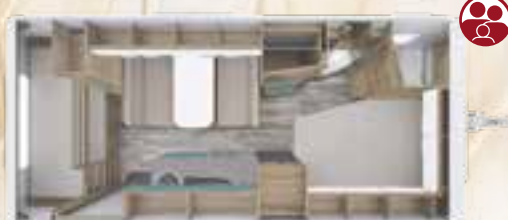
PEP 550 DM 2,3