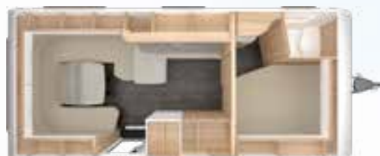
VIVALDI 560 TDL 2,5