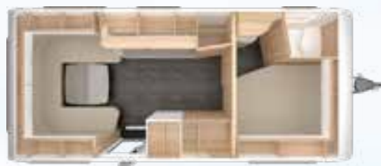
VIVALDI 560 TD 2,5