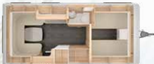
VIVALDI 550 E 2,5