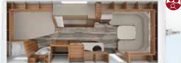
DA VINCI 655 KD 2,5