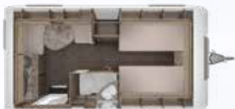
ROSSINI 450 E 2,3