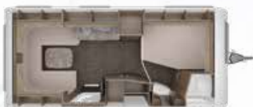
ROSSINI 490 TD 2,3