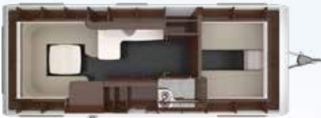
PUCCINI 655 EL 2,5