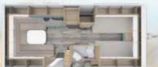
PEP 540 E 2,3