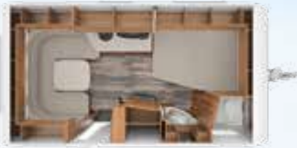
DA VINCI 450 TD 2,3