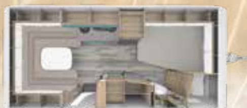
PEP 490 TD 2,3