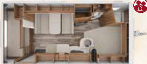
DA VINCI 540 DM 2,5