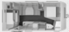
SÜDWIND 550 FSK