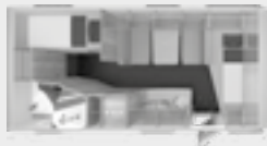
SÜDWIND 500 QDK